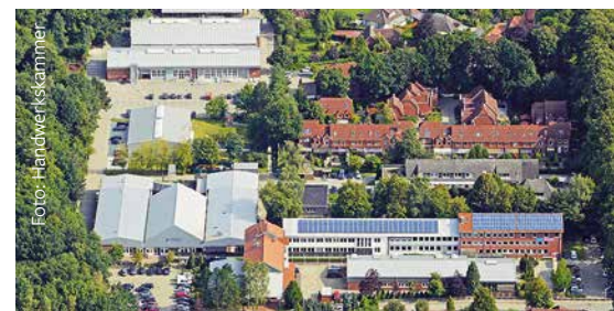
Die Handwerkskammer für Ostfriesland hält die Beratungsleistung für die Mitgliedsbetriebe weiterhin hoch.